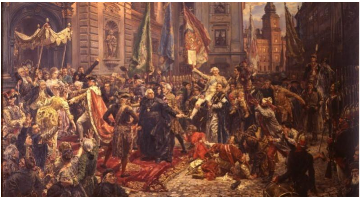
Obraz Jana Matejki – Konstytucja 3 Maja 1791 roku

3 maja 1791 roku uchwalona została Konstytucja Rzeczypospolitej Obojga Narodów. Była ona pierwszą konstytucją w nowożytnej Europie i zarazem drugą po amerykańskiej na świecie.