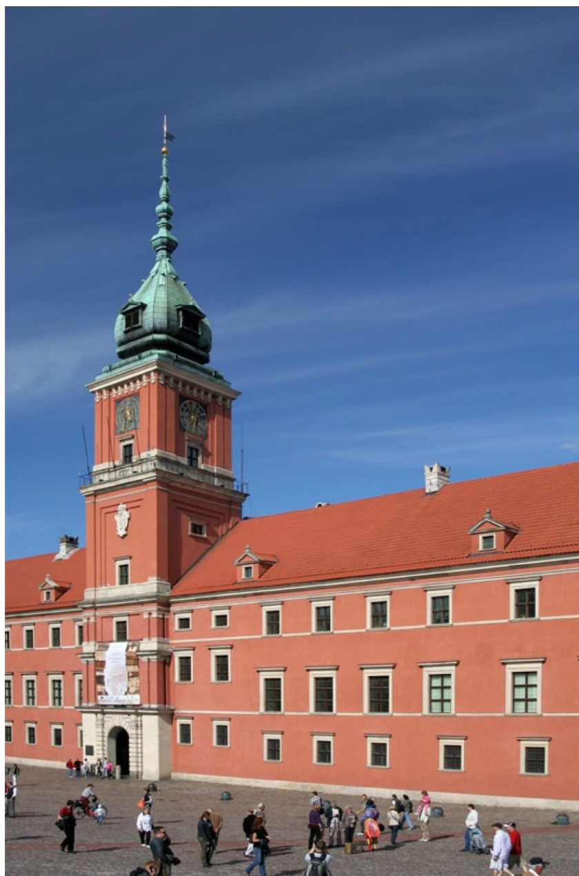
Zamek Królewski w Warszawie, miejsce uchwalenia Konstytucji 3 Maja

Ogólnie rzecz biorąc Święto 3 maja jest świętem radosnym. W całej Polsce odbywają się wiosenne imprezy, koncerty, a także rodzinne majówki.